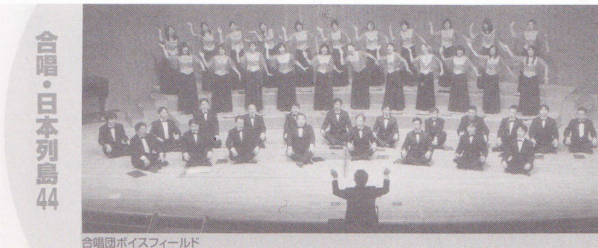
合唱団ボイスフィールド

合唱連盟の機関誌「ハーモニー」2011年春号に合唱団ボイスフィールドが紹介されました。