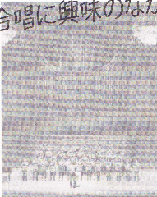
コーラスめっせ2011 (いづみホール)